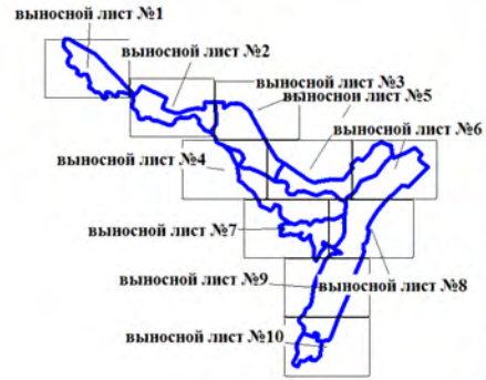
Схема расположения выносных листов